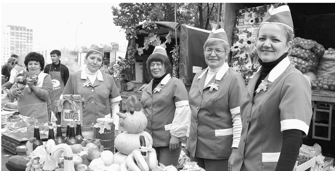
В республике начались традиционные осенние ярмарки.

В ходе совещания были обсуждены вопросы развития объединенных закупок товаров для торговых организаций потребительской кооперации, а также проблемы и перспективы реализации этого проекта.