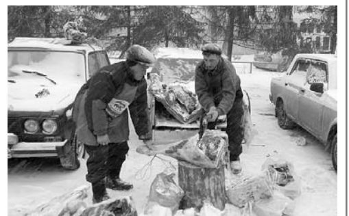
На снимке: на зимней ярмарке в Уфе.